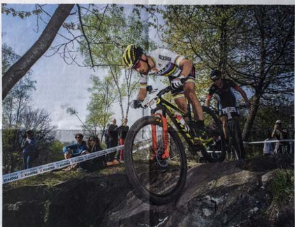
Nino Schurter non mancherà di certo all'appuntamento

In Ticino, in Svizzera, ma pure in una terra fertile come quella italiana, la passione per il ciclismo langau: sempre meno sono le vocazioni giovanili, sempre maggiori sono le difficoltà nell'organizzazione di competizioni. Uno scenario, invece, piuttosto desolante dal quale si discosta però una delle discipline del panorama delle due ruote: la mountain bike. In effetti, questo che ai suoi albori veniva chiamato "trampolino", ricomincia sempre maggiore interesse da parte dei giovani e le gare "bocciano" come accadeva trent'anni fa per il settore della strada.